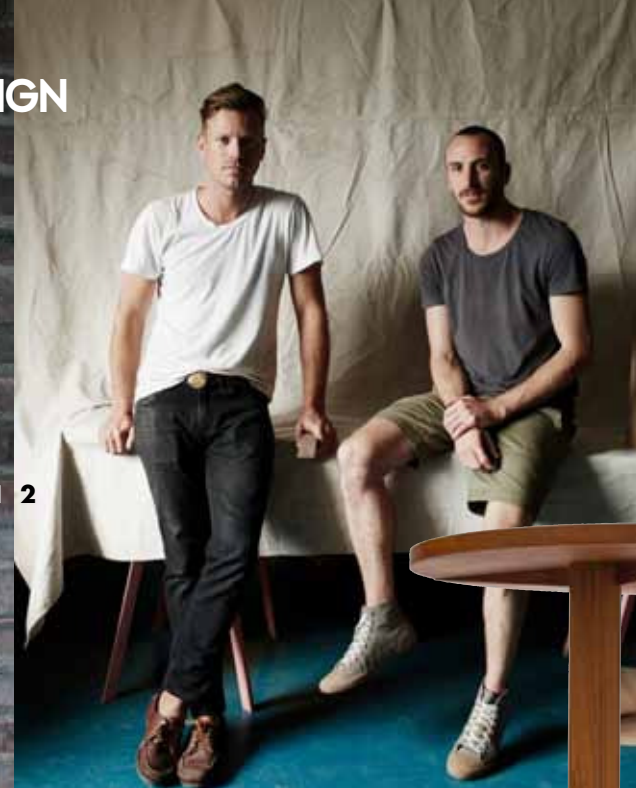
Table d'appoint "Foundation" en bois et pierre, design Fort Standard.