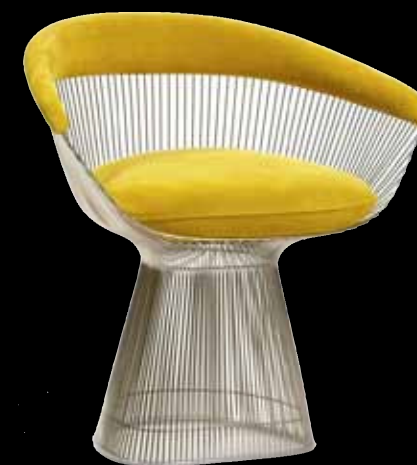
Sur le fil. Fauteuil "Platner Armchair", structure en acier, créé par Warren Platner (1966).