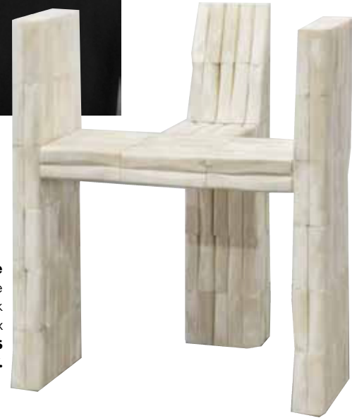
Néo-barbare Chaise "Trident" en os de bœuf, design Rick Owens (2012), 76 x 65 x 52 cm, CARPENTERS WORKSHOP GALLERY.