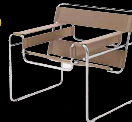
Bauhaus. Fauteuil "Wassily", structure en tube d'acier, de Marcel Breuer (1925).