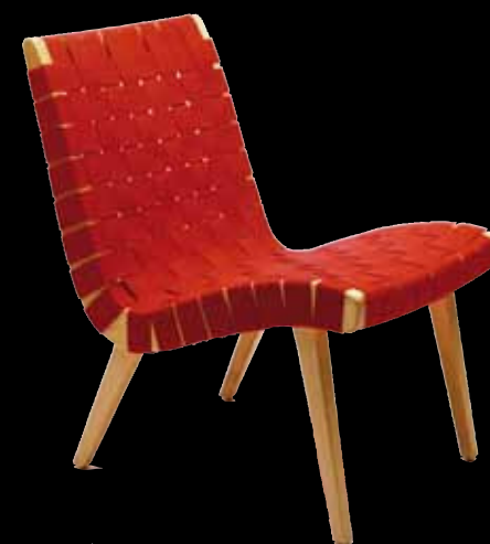
Style scandinave. Chauffeuse "Lounge chair" en érable et sangles en tissu, de Jens Risom (1943).