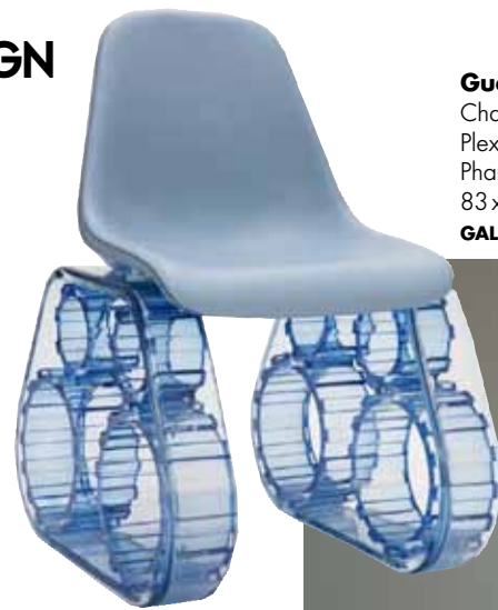
Guerre et paix Chaise "The Tank" en Plexiglas et cuir, design Pharrell Williams (2009), 83 x 53 x 63 cm, GALERIE PERROTIN.